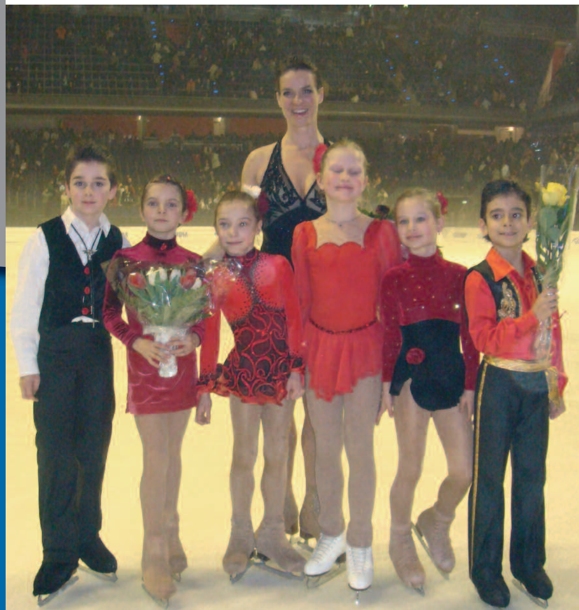
Katharina Witt, die mehrfache Olympiasiegerin, auf Abschiedstournee mit talentierten BSV 92 Eiskunstläufern/innen.